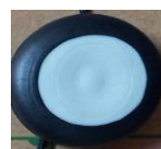
Photo du bouton émetteur

Nous vous souhaitons beaucoup de plaisir avec les solutions de Gentianes Group Notre équipe est à votre disposition pour tout complément d'information au 058 750 07 00